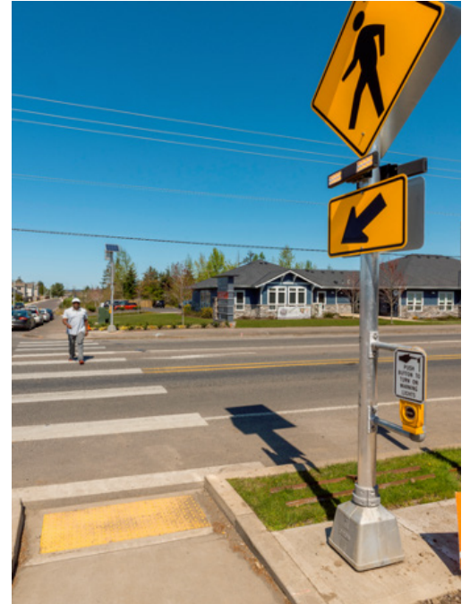
Ejemplo de un cruce con baliza rectangular de intermitencia rápida (RRFB) finalizado, lo que permite el cruce de peatones más seguro y visible.